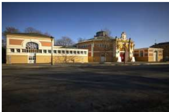
Le cirque historique qui abrite le CNAC depuis sa création