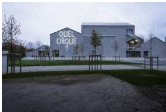
La Marnaise – Bâtiments contemporains du CNAC